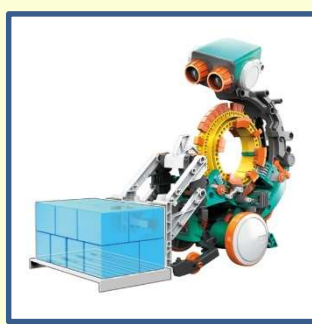
『ビットさん』 プログラミングホイールに指示を出す部品を取り付けることで、ロボットの動きをプログラミングできます。