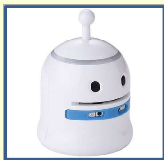
『True True』 カードの指示を読み込ませてプログラミングできるロボットです。

※True True では、プログラミングの考え方を学んでいただきます。お持ち帰りいただけませんので、ご注意ください。ビットさんはお持ち帰りいただけます。