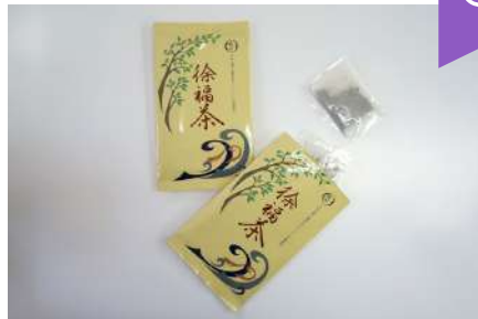
※画像は、徐福茶(銀)です。