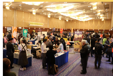
(昨年度 会場の様子)

商談会や展示会へ初めて出展される方等には出展に向けた個別フォローも実施予定。お気軽にご相談ください。