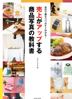
やまぐち先生の著書