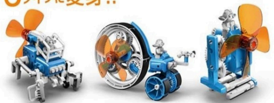
ウインドウォーカー