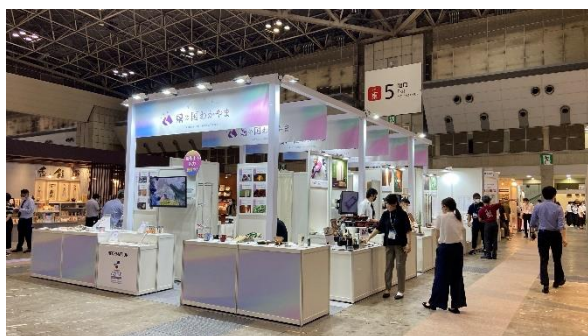
<R4 東京ギフトショー和歌山県集団出展ブース>

今年度の装飾事業者及び装飾内容については、6月頃に決定する予定です。ブースイメージは下記の写真を参考にしてください。なお、写真はあくまでも参考であり、本決定ではありませんのでご注意ください。