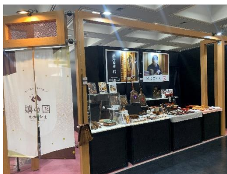
<R4 京都ギフトショー和歌山県集団出展ブース>