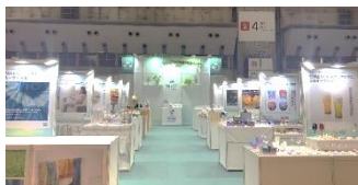
<R5 東京ギフト・ショー 出展の様子>